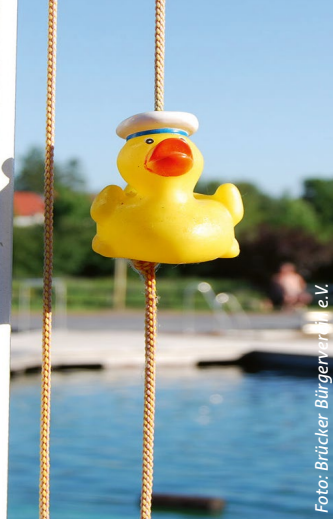
Foto: Brückler Bürgerverein e.V. Foto: Brückler Bürgerverein e.V.